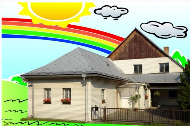
Dom Liptovský Trnovec