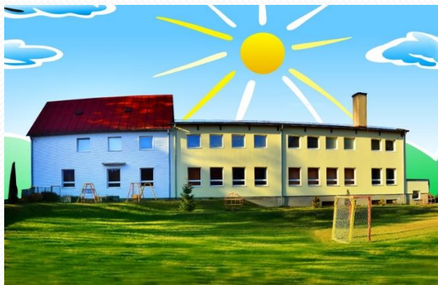
Dom Kráľova Lehota