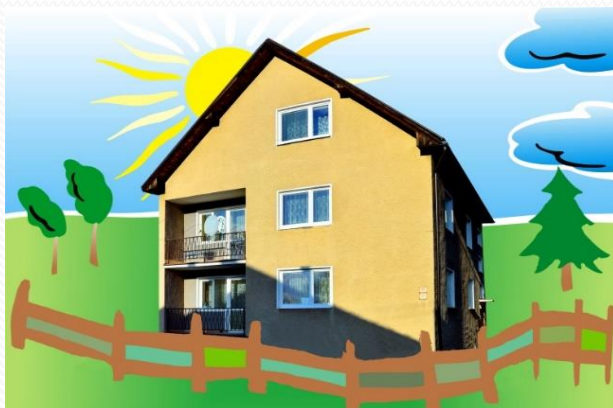
Dom Liptovský Mikuláš