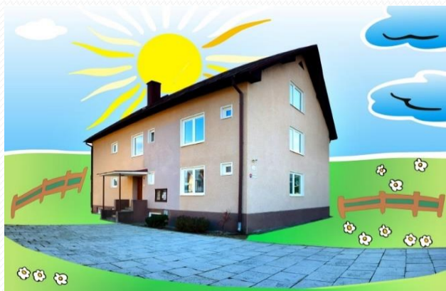
Dom Liptovská Porúbka