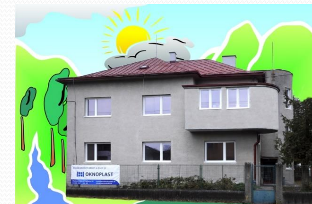
Dom Liptovský Hrádok II