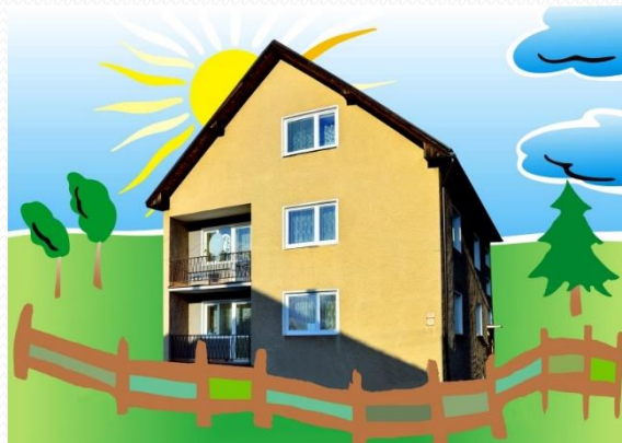
Dom Liptovský Mikuláš