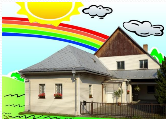
Dom Liptovský Trnovec