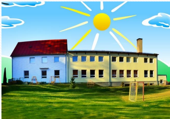
Dom Kráľova Lehota