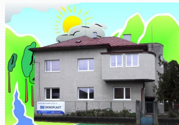
Dom Liptovský Hrádok II