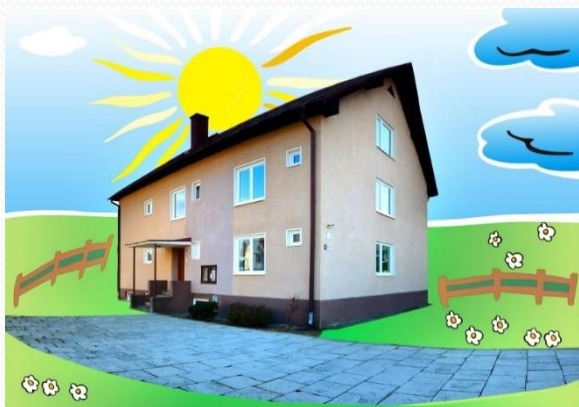
Dom Liptovská Porúbka